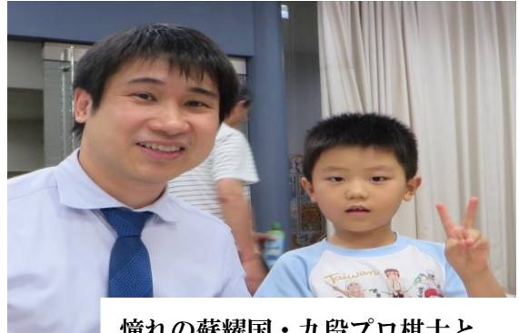
憧れの蘇耀国・九段プロ棋士と 憧れの蘇耀国・九段プロ棋士と