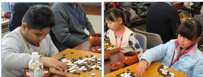
昇級のかかる対局は真剣・・・