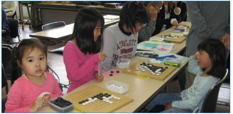
入門・初級コース「教室の1コマ」