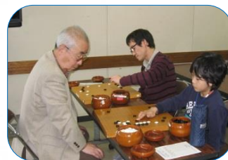
教室風景：講義と指導対局