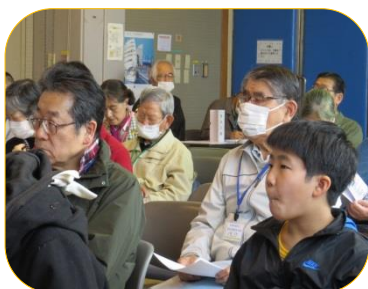
入門・初級コース